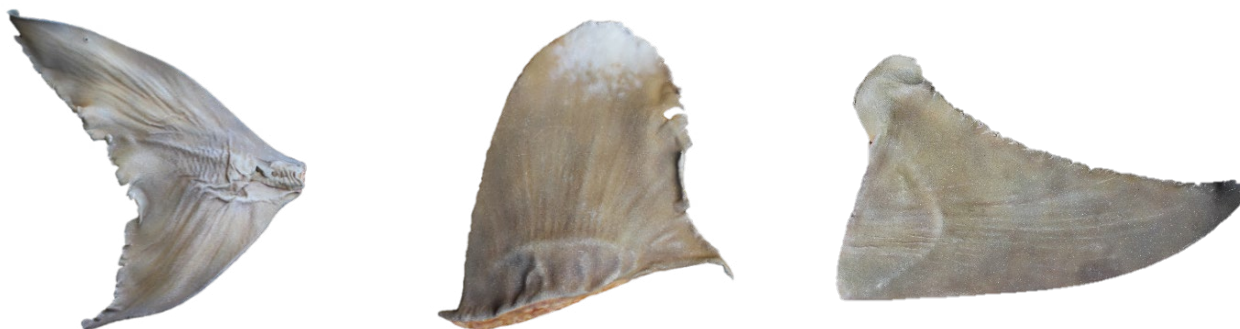
Répliques après peinture (nageoire caudale de raie-guitare à nez rond, nageoire dorsale de requin longimane, et nageoire pectorale de grand requin-marteau)

Des images des côtés et de la base de chaque nageoire ainsi que la manière de les peindre, les différents pinceaux et les peintures aéroglyphes à utiliser pour former les motifs souhaités, sont disponibles ici .