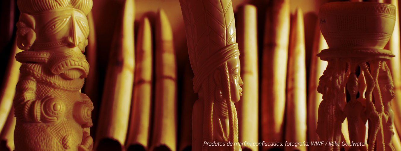
Produtos de marfim confiscados.